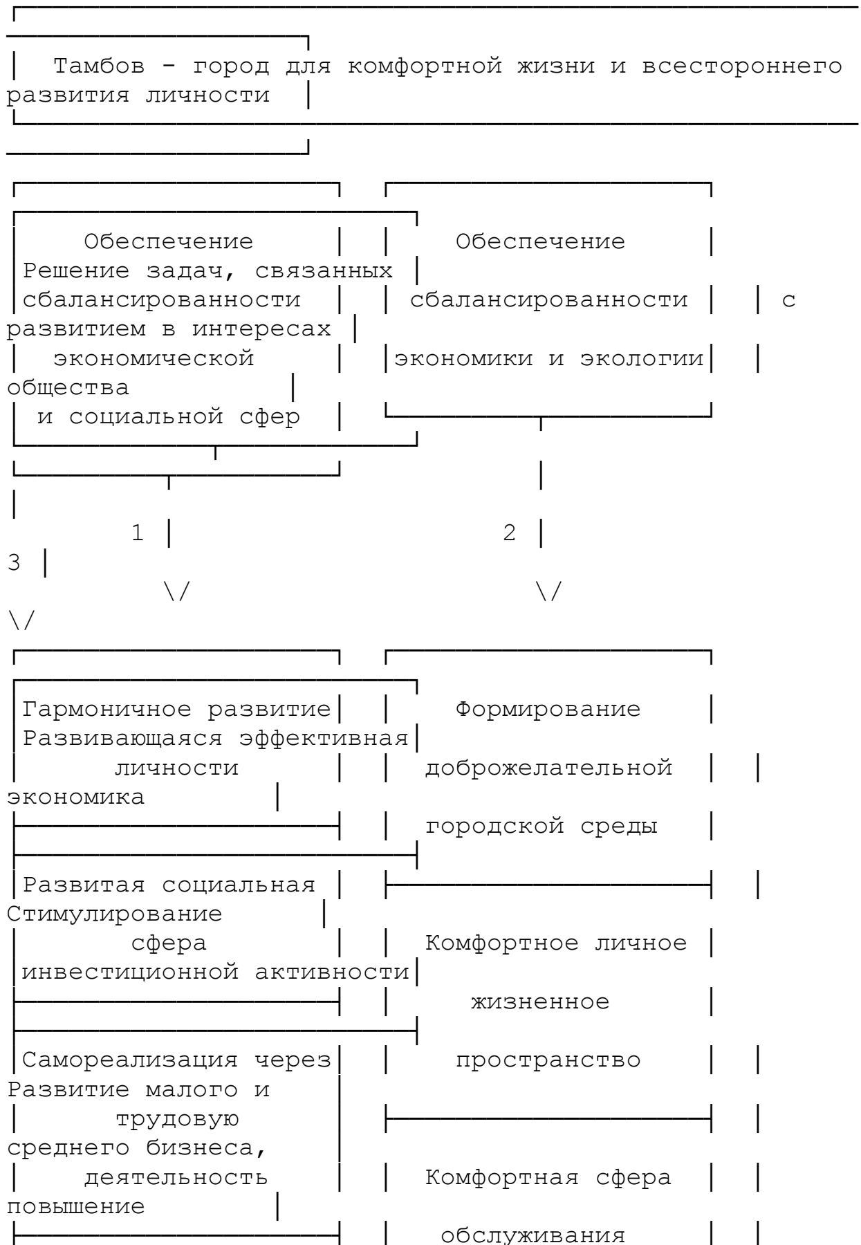
Рис. 2. Концепция развития города Тамбова